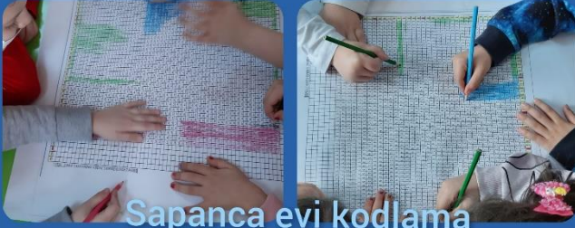
Sapanca evi kodlama çalışması