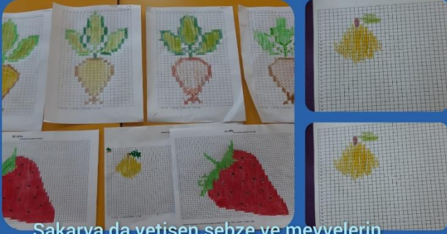
Sakarya da yetişen sebze ve meyvelerin tanıtılıp kodlanması