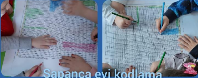
Sapanca evi kodlama çalışması